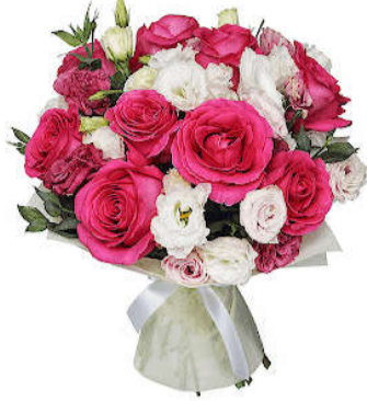
Жена, дочь, внуки.

“Нам на радость жить подольше, Счастья увидеть побольше! Внуков, правнуков растить И всегда веселым быть!”.